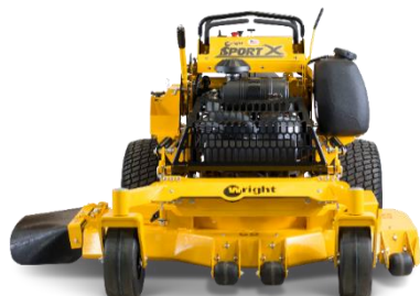
Sport X WSPX52SFX730E - 132cm ZL