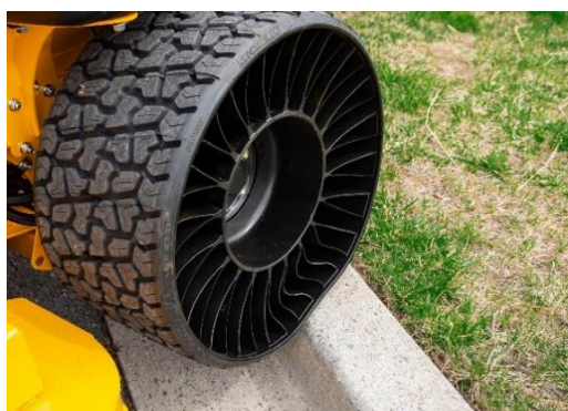
Tweel wielen 18x8.5