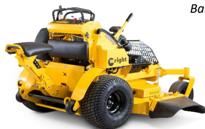
Sport X WSPX52SFX730E - 132cm ZL